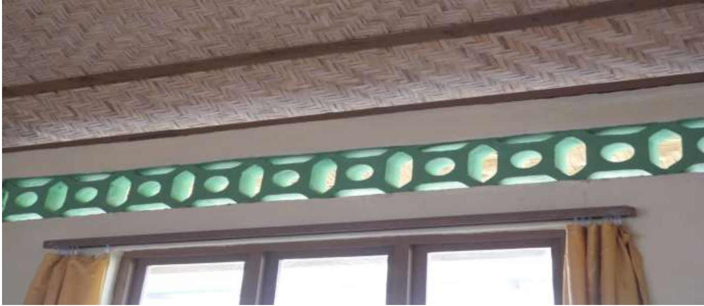
Gästezimmer in Longko