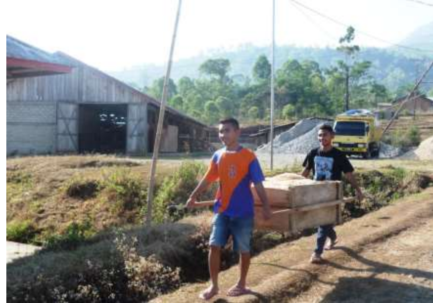
Schüler bei den täglichen Aufräumarbeiten