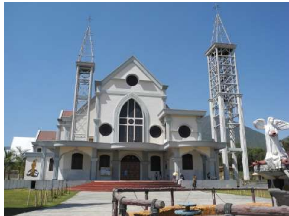
Kirchen in Flores