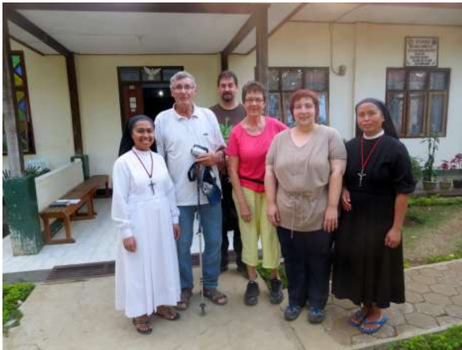
Kindergarten in Wankung