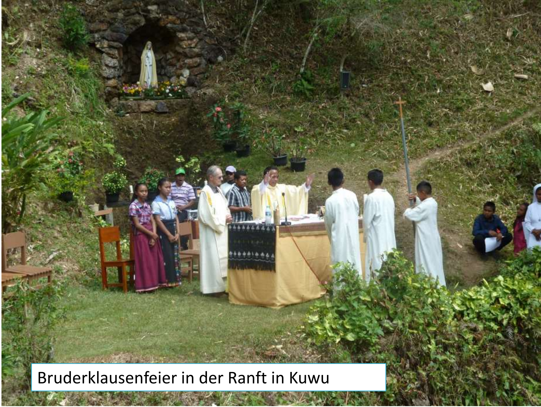
Bruderklausenfeier in der Ranft in Kuwu