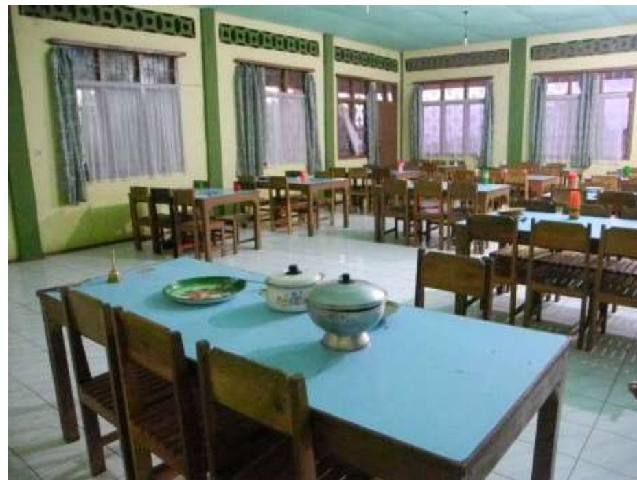
Küche und Essraum für Proxus in Longko