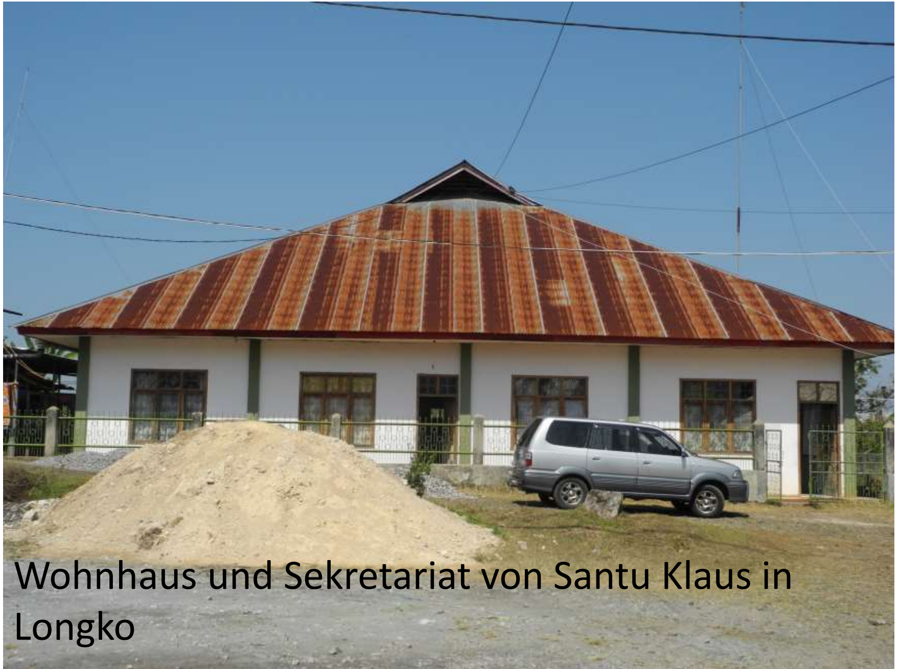
Wohnhaus und Sekretariat von Santu Klaus in Longko