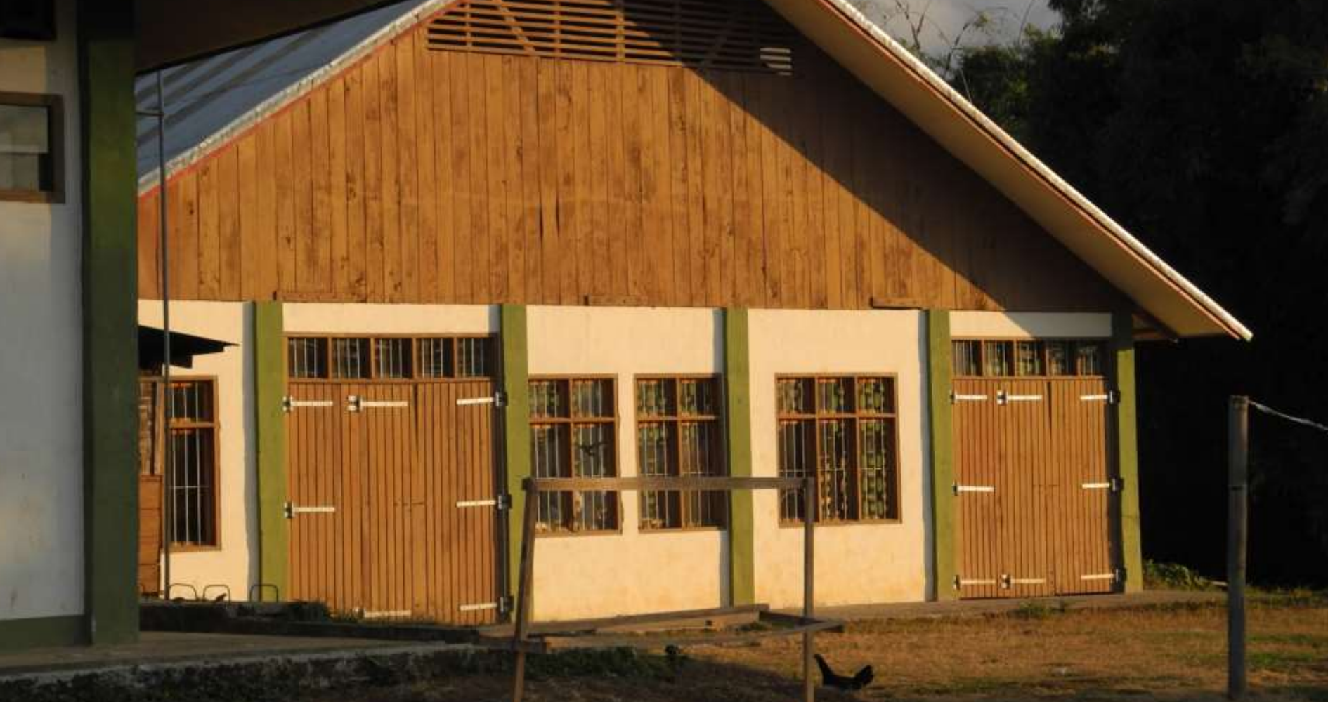
Longko: Mädchen Schreinerei