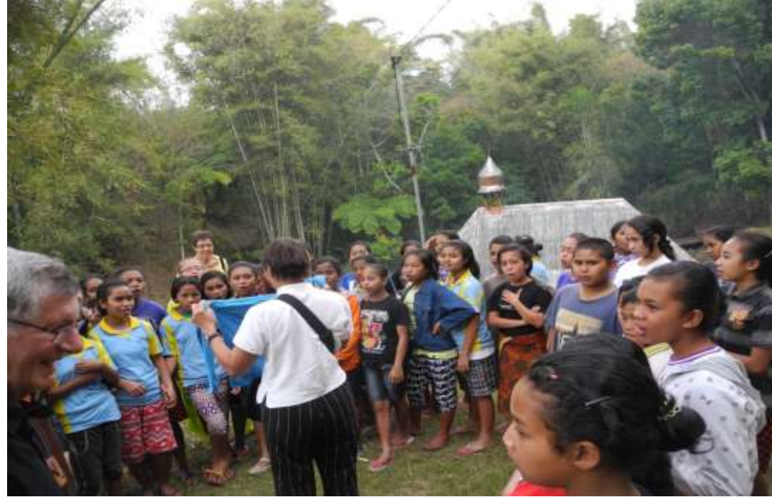
Bruder Klausen Feier in der Ranft in Kuwu